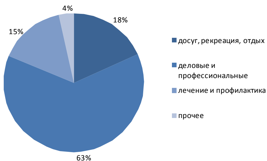
Рисунок 1. Размещение лиц по целям поездок в коллективных средствах размещения

Численность размещенных в коллективных средствах размещения в 2009 году составила 133,7 тыс. человек, что на 9,8% больше уровня 2007 года (121,7 тыс. чел).