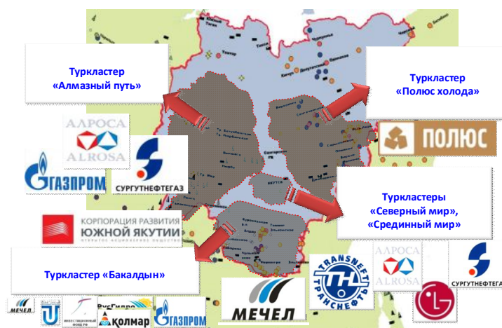
Рисунок 4. Туристские кластеры Республики Саха (Якутия)

Кластерный подход – основа стратегического развития Республики Саха (Якутия). Стратегия развития Республики Саха (Якутия) предполагает формирование крупных промышленных узлов по кластерному типу, которые функционально связаны с реализацией крупных инвестиционных проектов на территориях Красноярского, Хабаровского и Приморского краев, Иркутской и Амурской областей.