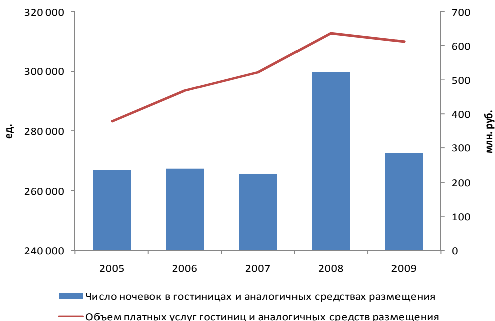
Рисунок 3. Объем услуг гостиничного хозяйства Республики Саха (Якутия)

Число ночевок в гостиницах и аналогичных средствах размещения в 2009 году составило 272,4 тыс. размещений. Объем платных услуг гостиниц и аналогичных средств размещения за последние 5 лет вырос на 62% и составил в 2009 году 612,4 млн руб. (в 2005 году – 377,9 млн руб.).