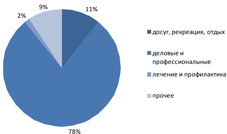
Рисунок 2. Размещение лиц по целям поездок в гостиницах

Количество размещенных лиц в гостиницах за 2009 год составило 103145 лиц, из которых 78% прибыли в республику с деловыми и профессиональными целями.